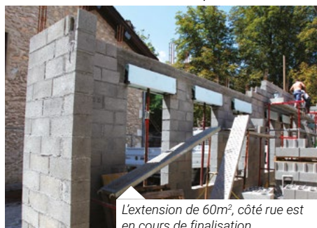
L'extension de 60m 2 , côté rue est en cours de finalisation.

Aujourd'hui, les travaux de charpente, de plomberie et d'électricité ont démarré avec notamment l'installation du chauffage au sol et de la ventilation double flux de ce nouvel équipement communal.