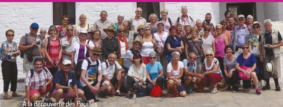
À la découverte des Pouilles