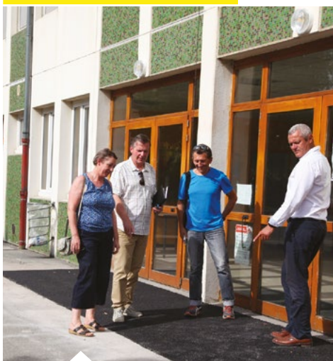
Des rampes devant l'entrée principale et l'ensemble des portes donnant dans la cours ont été créées.

À l'école Louis-Armand, les travaux de l'été ont porté sur la mise en accessibilité des locaux avec la création de rampes au portillon d'entrée ainsi qu'au niveau de toutes les portes côté cours. Quant aux portes intérieures, trop étroites pour répondre aux critères d'accessibilité en vigueur, elles ont été remplacées.