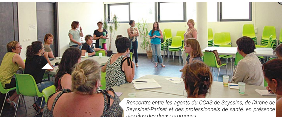
Rencontre entre les agents du CCAS de Seyssins, de l'Arche de Seyssinet-Pariset et des professionnels de santé, en présence des élus des deux communes.

Deux semaines après, c'est au tour du multiaccueil d'inviter parents et petits, âgés de 2 mois et demi à 4 ans, qui fréquentent la structure. Ils ont partagé un moment convivial, autour d'un goûter et des chansons proposées par différents intervenants.