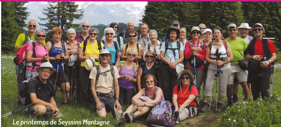
Le printemps de Seyssins Montagne

Le bureau souhaite à toutes et à tous une bonne saison sportive.