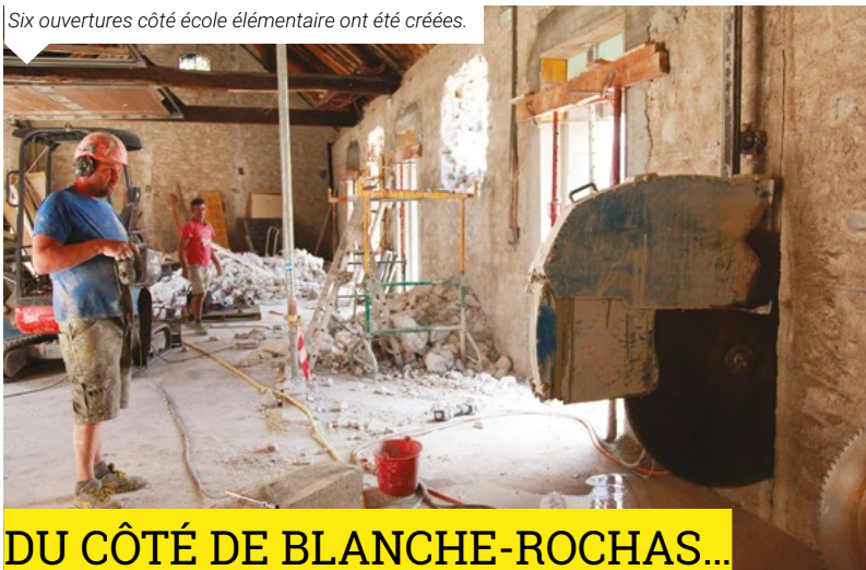
Six ouvertures côté école élémentaire ont été créées.

Début du chantier le 11 septembre pour une durée de trois mois.