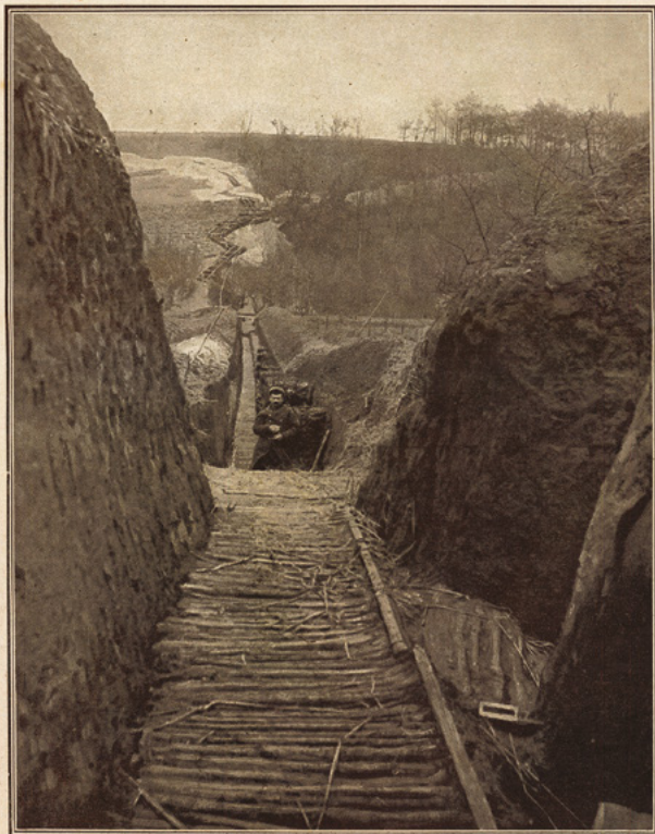
Cette tranchée de communication, qui s'allonge au loin dans la plaine, prouve que nos soldats sont passés maîtres dans cet art si nouveau pour eux : la construction en est parfaite. A droite s'ouvre le boyau qui conduit aux tranchées de combat.