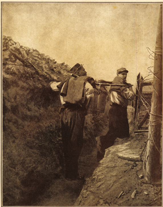
Les pailles de coque reviennent des cuisines ; en suivant le boyau de communication, ils vont aux tranchées où les camarades attendent la soupe ; les marmites passées sur un bâton, la capote est levée, car il fait chaud et elle sert de tampon, ils arriveront bientôt à destination ; les voies un réseau de fil de fer et maintenant il faudra avancer prudemment pour éviter les balles ennemies.