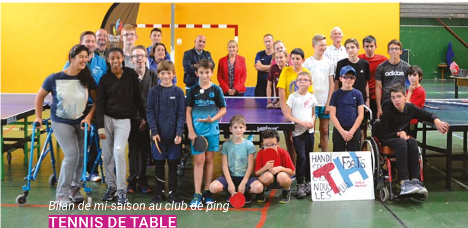
Bilan de mi-saison au club de ping