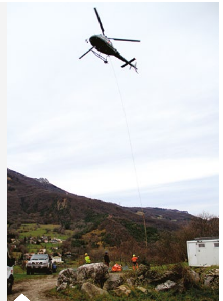
Hélicoptage lors des travaux pour la sécurisation du site et l'installation de grilles permettant le passage des chauves-souris dans les différentes cavités des anciennes exploitations du ciment Vicat.

Enfin, des animations nature, financées par le département dans le cadre du programme « En chemin vers les ENS », sont proposées depuis septembre aux écoles seyssinoises et clairoises. L'objectif étant de sensibiliser les plus jeunes au respect de leur environnement proche et à la protection de la biodiversité, tout comme les actions menées auprès du grand public en partenariat avec la Ligue pour la Protection des Oiseaux, France Nature Environnement et Gentiana.