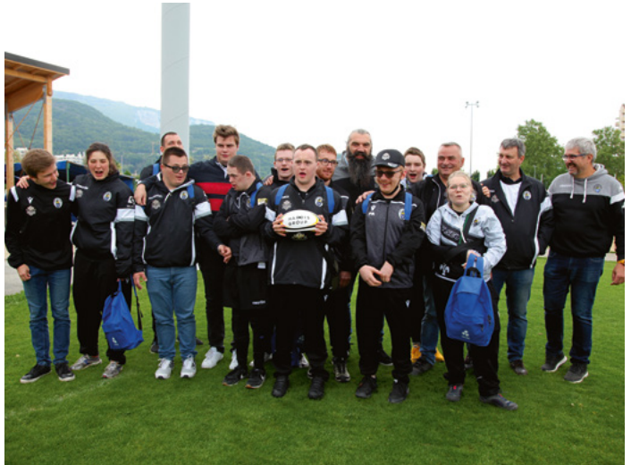
Sébastien Chabal, parrain de la compétition, a remis à l'ensemble des équipes des sacs de sport et des ballons de rugby. Ici, le joueur international avec l'équipe seyssinoise des Fabulou's.

Peu importe le score, ici tout le monde a gagné et en premier le sport adapté.