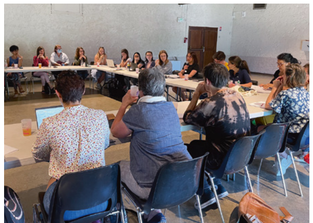
Jeudi 12 mai, la commune a accueilli à la ferme Heurard la réunion bimestrielle du réseau d'égalité femmes-hommes métropolitain.

L'égalité femmes-hommes est l'affaire de toutes et de tous. »