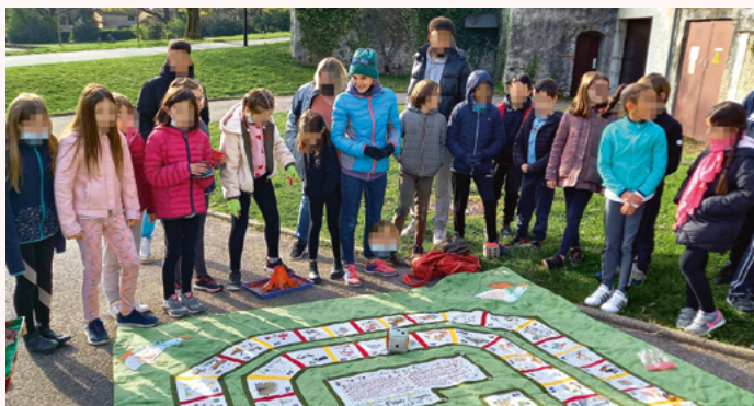
Jeu de l'oie

N'hésitez pas à visiter notre site seysarts.fr pour retrouver toutes les informations sur notre association. Nous vous accueillerons aussi pour le forum des associations le 10 septembre, ce sera l'occasion de découvrir notre salle de peinture et de rencontrer les acteurs de Seys'Arts.