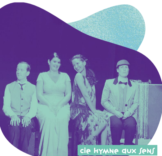
cie Hymne aux sens