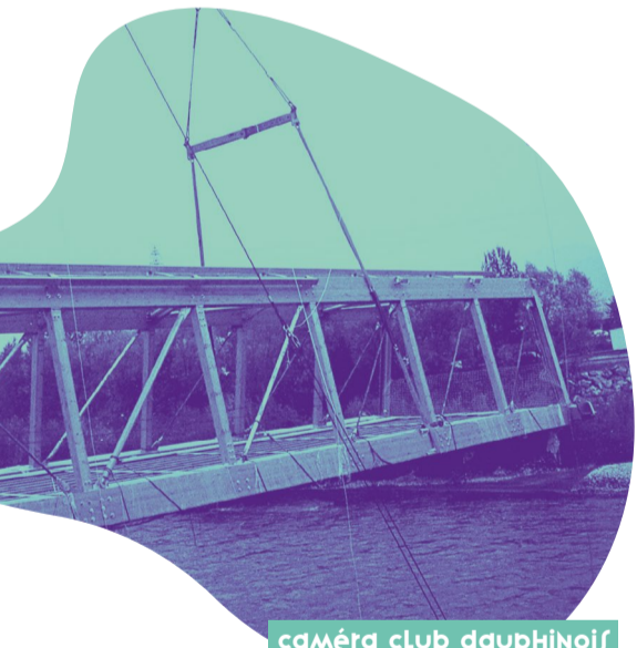
caméra club dauphinois

Dans un second temps, le tramway C sera à l'honneur. Vous pourrez vivre ou revivre son inauguration, haute en couleurs, organisée en mai 2006.