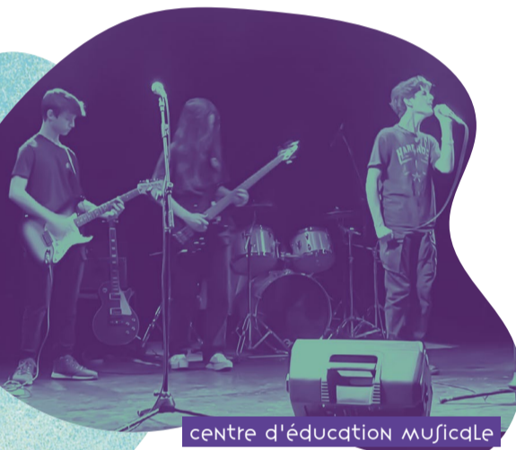
centre d'éducation musicale

Venez vibrer aux sons des guitares rock et partager une soirée rythmée par la bonne humeur et l'énergie !