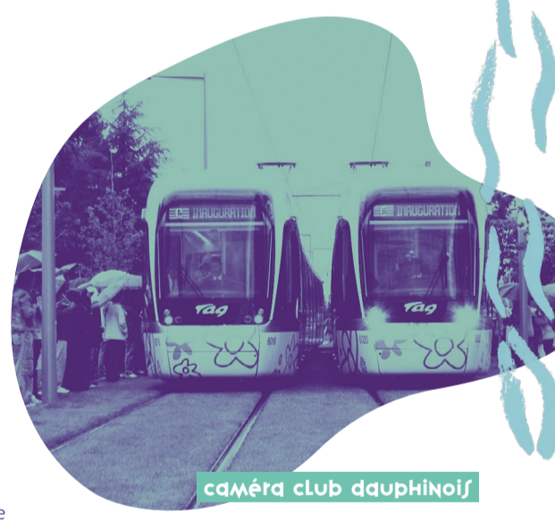
caméra club dauphinois

Passé, présent et avenir... Parcourez en images quelques moments forts de réalisations à Seyssins : • les fouilles entreprises lors de la construction de l'ÉcoQuartier de Pré Nouvel qui ont permis de découvrir des vestiges romains. • la réalisation de l'Ehpad « Les Orchidées », des travaux de fondations jusqu'à son inauguration. • l'installation de la nouvelle stèle et de l'espace des commémorations dans le cimetière des Garlettes.