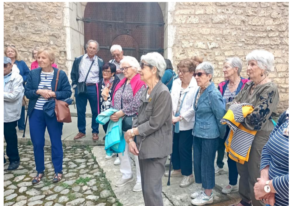
Sortie au Château de Virieu - juin 2025