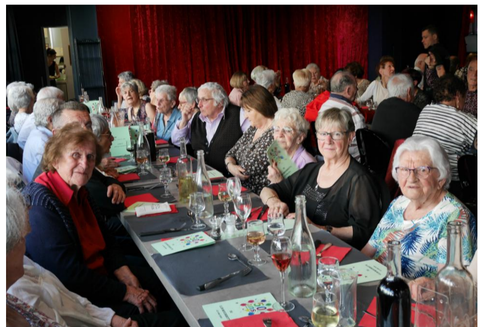
Dîner-spectacle à La Villa (Montbonnot-Saint-Martin) pour les 50 ans du Club - 2023