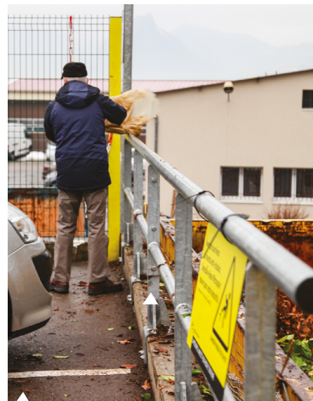
Les barrières métalliques compliquent le déversement des déchets : trop de hauteur pour les usagers ; impossibilité de faire basculer le contenu d'une remorque... Résultat, les dépôts sauvages de déchets végétaux ont tendance à se multiplier.

hauteur des barrières métalliques installées devant les bennes de déchargement a ainsi été le principal sujet de discussion. Cette installation répond à une obligation réglementaire. Elle soulève quelques interrogations, notamment en termes de hauteur et de barreudage intermédiaire qui compliquent le déversement des déchets.